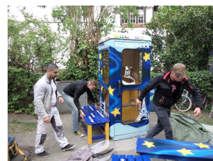
Künstler mit angehenden Maler & Lackierer

Mechatroniker gestalten das Regal mit integrierter Lichttechnik