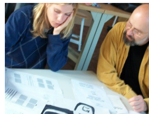
Externe Künstler beraten, um das Thema umzusetzen