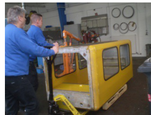
Vorbereiten der gelieferten alten Telefonzelle